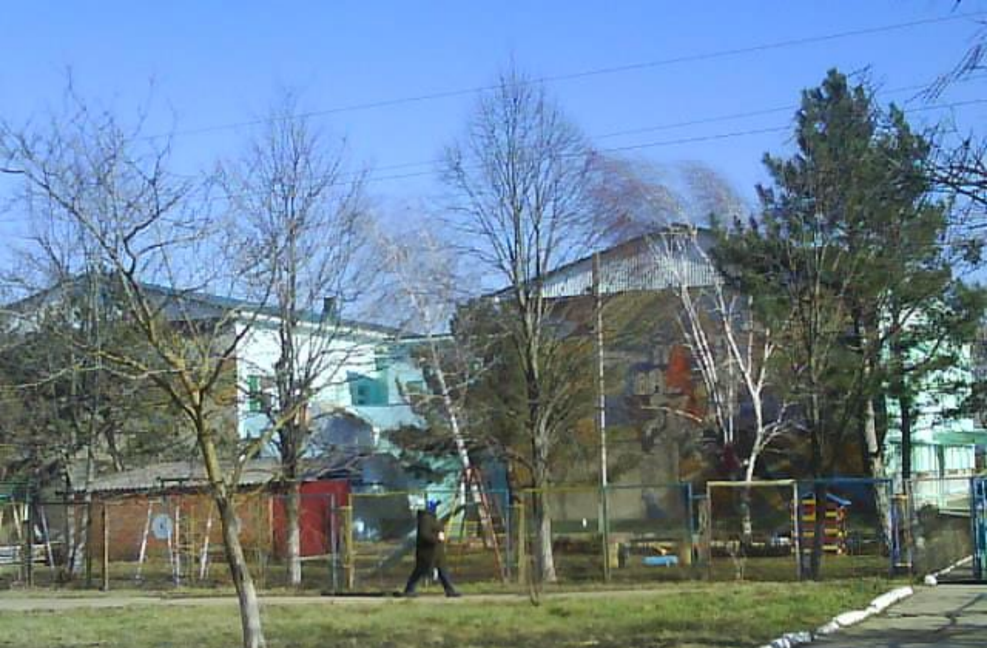
Детский сад № 41 «Аистёнок»