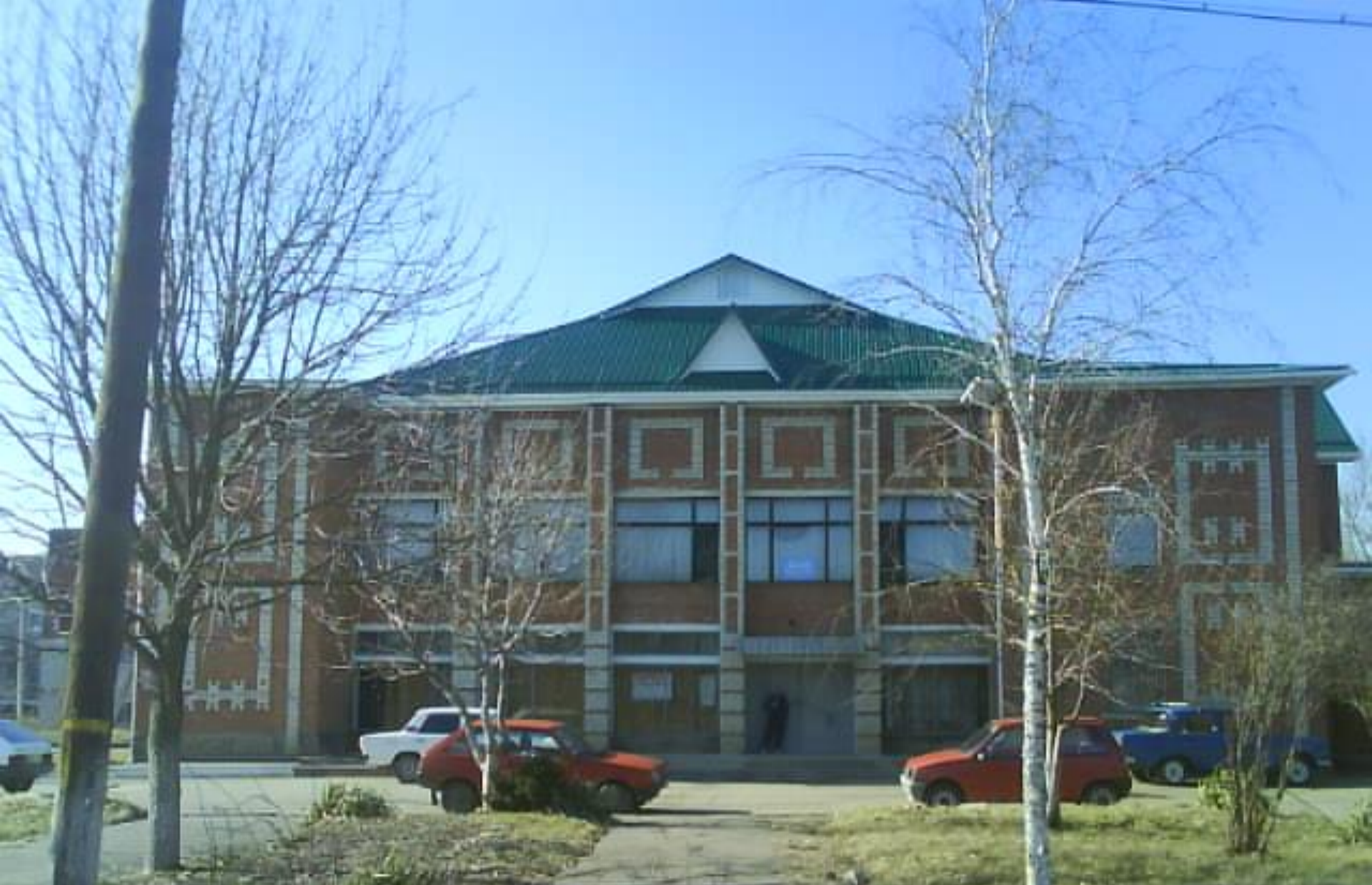
Дом культуры «Автомобилист»