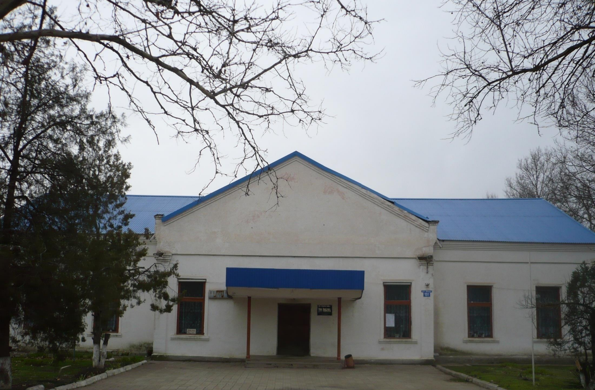
Дом культуры «Смоленский»