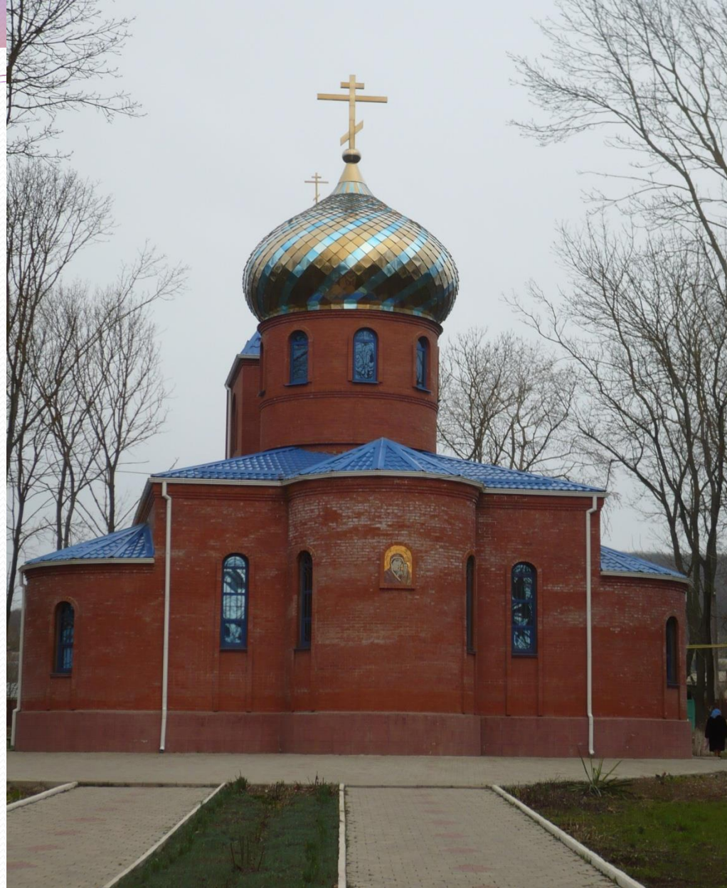
Храм Казанской Божьей Матери