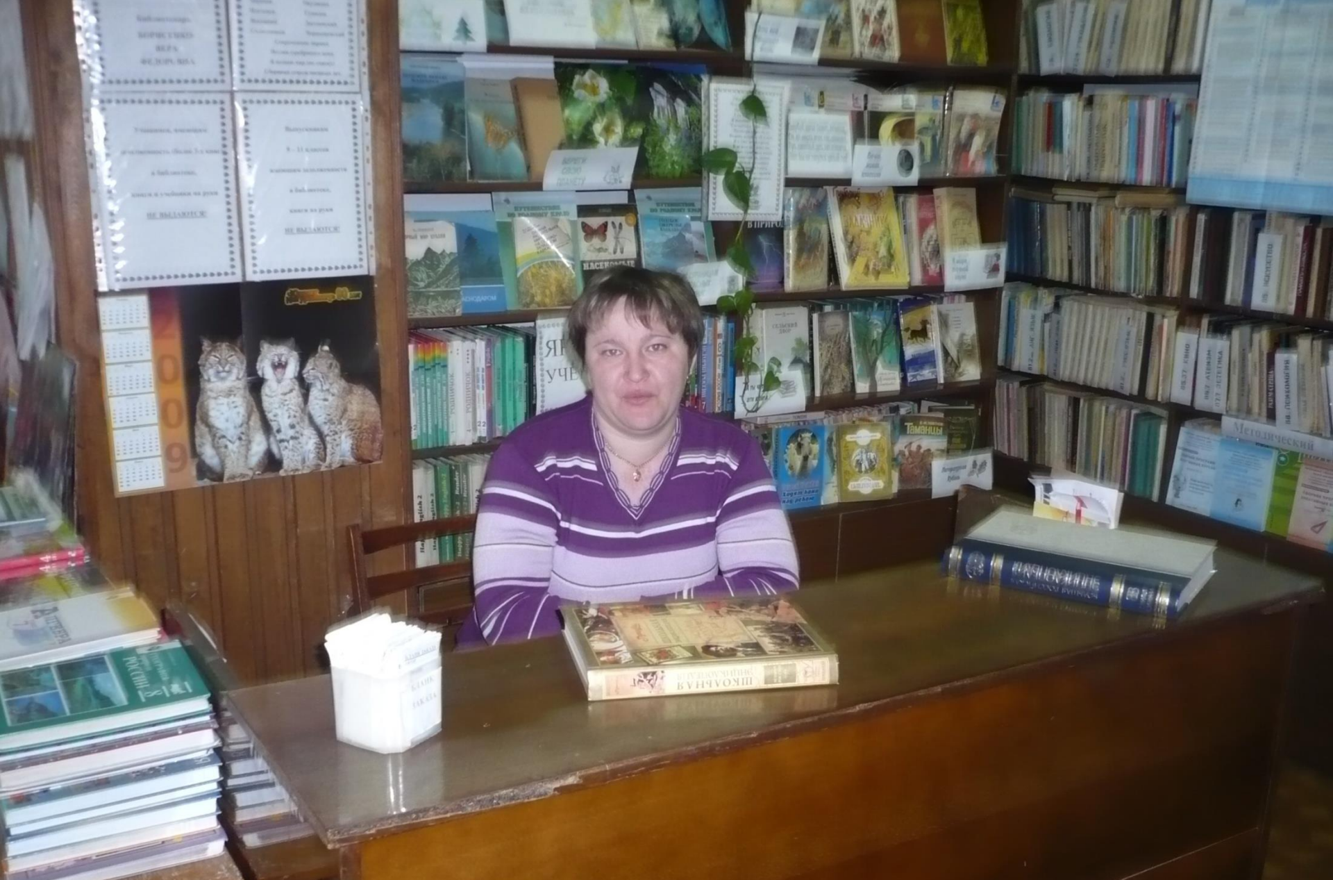
Рабочее место библиотекаря