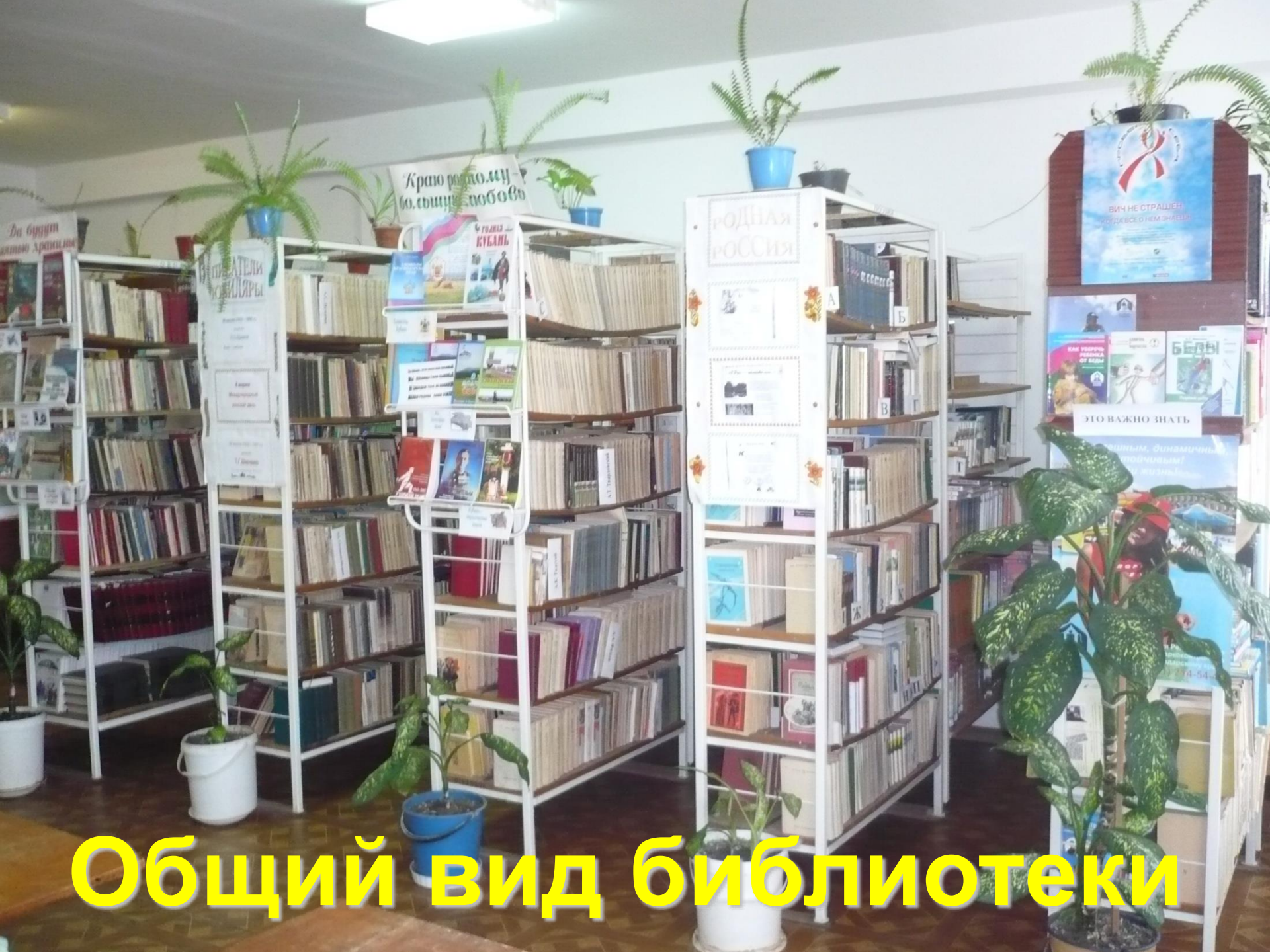
Общий вид библиотеки